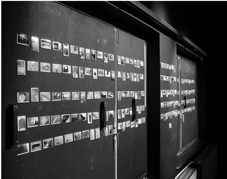
Abb. 3: Wie viel Plastik hast Du in Deinen eigenen vier Wänden? Fotografische Dokumentation (begehbare Installation "Soziale Plastik").