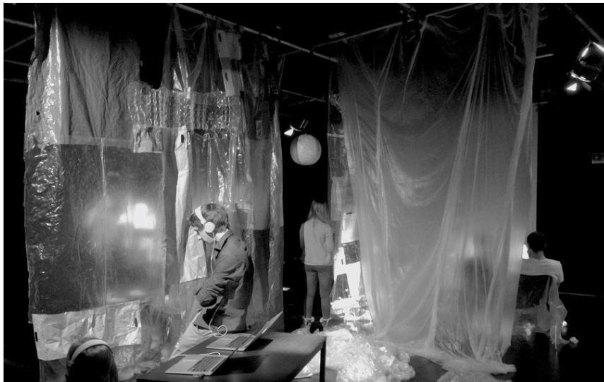
Abb.1: Begehbare Installation "Soziale Plastik" (2018, HBK Braunschweig).

Wie kann im Medium der Kunst ein Bildungsprozess angestoßen werden? Wie verwandelt sich ein Alltagsthema in ein Kunstwerk? – Forschungsfragen der Theaterinstallation „Soziale Plastik“.